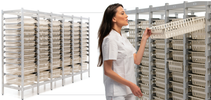
Sistema de almacenamiento de aluminio anodizado totalmente modular para cestas y bandejas ISO Sistema Salus