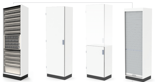
Armario para farmacia y material fungible: en ABS, en polipropileno y madera contrachapada laminada Armarios