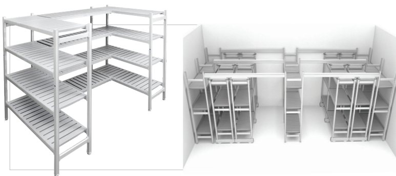
Sistema de almacenamiento totalmente modular de aluminio anodizado, con estantes de polímero, para material en cajas – gran volumen Línea Salus