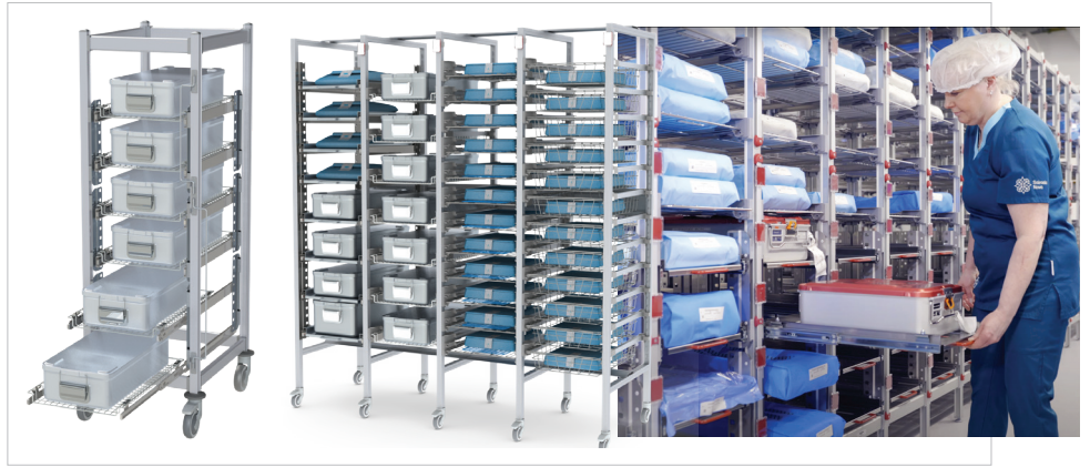
Estructura de aluminio anodizado y sin agujeros, sistema de estanterías, sistema ISO 6040, "No Touch" para kits embolsados Línea Salus | Línea Hygieia