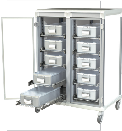
Carros de transporte cerrados para esterilización Línea Apollo